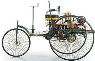
Benz-Patent-Motorwagen Nummer 1 aus 1886